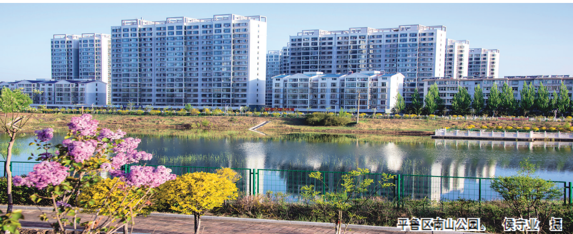
平鲁区南山公园。

排水管网覆盖率达到80%,集中供热普及率85.4%,城区气化率75%,公共交通实现全覆盖,建成区绿化面积达到240多万平方米,人均公共绿地面积14.1平方米,绿化覆盖率达到46%,园林式住宅小区达到12个,主次街道保洁面积136万平方米,城市街道机扫率达到36%,初步形成“绿树成荫,城园相融,绿水相间,人与